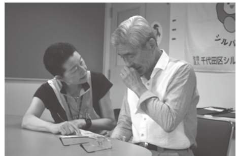
測定結果を真剣に聞く会員

齢者の平均を比較したところ、体脂肪率が低く日常での就業活動が活発で筋肉量が維持され、体脂肪がよく燃焼されているとの傾向がありました。さらに、特に体幹部分での筋肉量が多いため、姿勢の保持やバランス機能が安定した動作につながっているのではないかと分析結果でした。