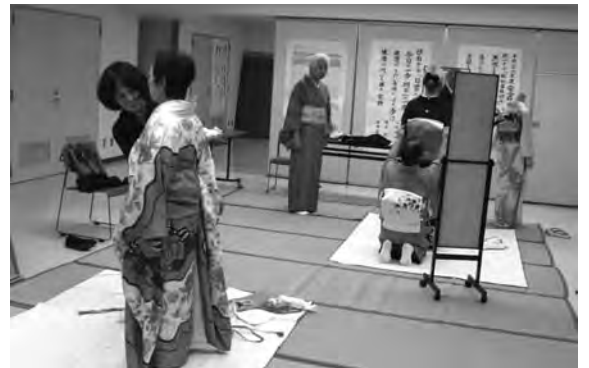
スキルアップ着付教室

センターの事業理念等を踏まえ、希望する業務分野の技能を意欲的に修得して就業の機会に繋げていくため、会員及び区内在住の高齢者を対象に、内外講師による各種研修会及び講習会を開催します。