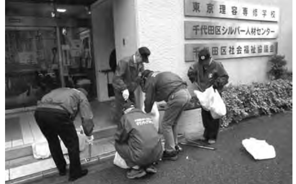
白山通り清掃活動

センター事業の一環として会員による社会奉仕活動を積極的に実施するため、各地域班で協議して実施すると同時に、センター会員に活動要請があったものについては、随時、会員からのボランティアを募り、清掃ボランティアなどの社会奉仕活動を継続して実施します。白山通り清掃活動は、毎月第1木曜日午後1時から事務所前を中心にして実施しています。