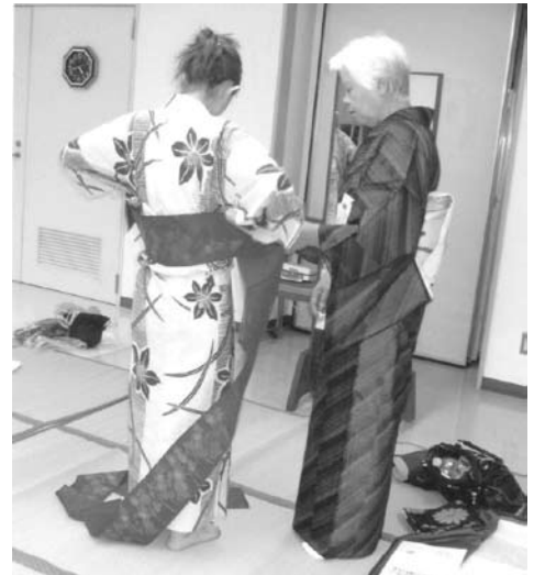
昨年好評だった「着付け事業」の充実