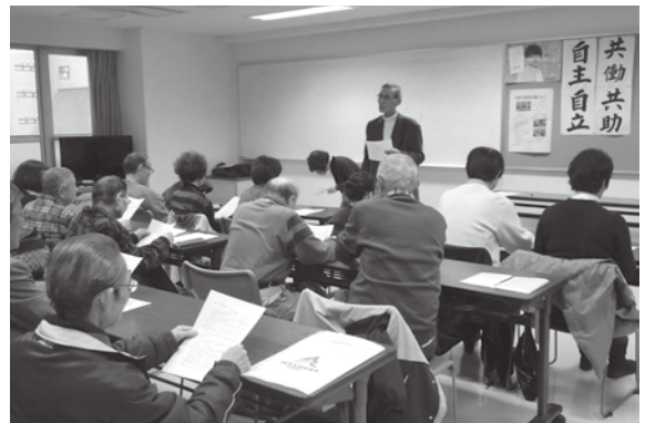
リーダー研修会風景

さらに、前任リーダーより引き継がれた就業マニュアル等を理解し、現状に合った内容に整備することが必要です。