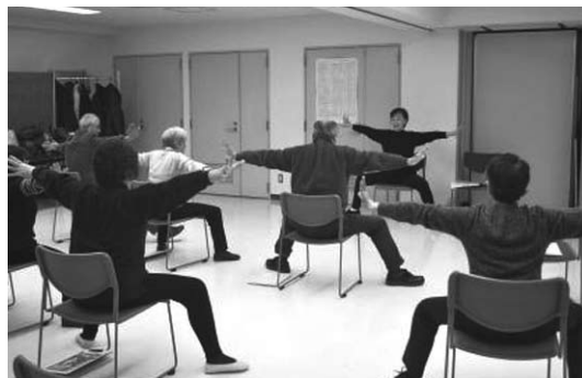
「貯筋体操」講習会開催風景

具体的には全体会議等会員が多く集まる機会を活用し、高齢者の交通安全意識の高揚や転倒予防に関する講習会を開催します。