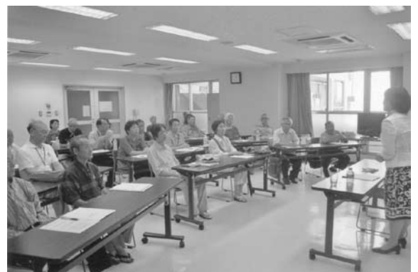
会員接遇研修風景