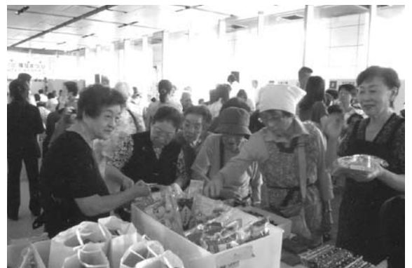
地域イベント「福祉まつり」参加風景