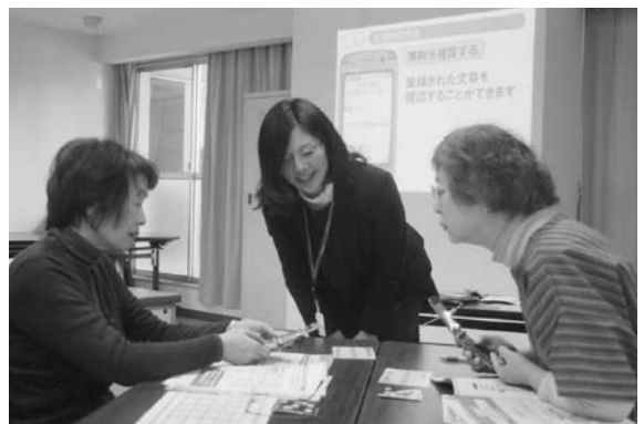
「災害伝言板」体験教室

今回ドコモの体験用の携帯電話を使い、「災害用伝言板」体験サービスの提供期間の機会を利用し、社員の方にサポートいただきながら、センター会員及び区内在住の知人を含め、合計13名の方が体験されました。