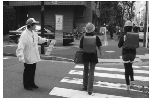
児童登下校「子ども見守り隊」

高齢者が地域で働くことを通じて、活力ある高齢社会、地域社会づくりに貢献するとともに、健康で生きがいのある生活ができることを目指しています。千代田区に居住する、60歳以上の健康な方を入会条件とし、企業や家庭、公共団体などから仕事を引き受け、会員の方々に仕事を提供しています。第2・第4火曜日に入会説明会を開催していますので、知人等興味のある方にお知らせ下さい。