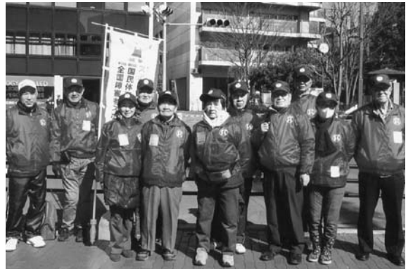
東京大マラソン祭り

2月24日(日)に開催された“東京大マラソン祭り2013”。今年も、当センターの会員10名がイベント会場での観客整理・案内ボランティアに参加！ランナーや声援を送る観客のサポートをし、一緒になって東京大マラソン祭りを盛り上げました！！