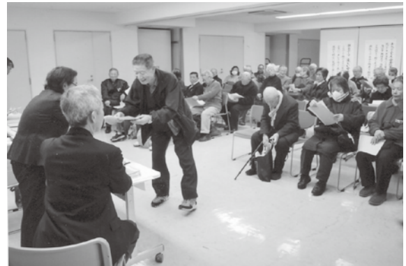
全体会(就業先の発表)風景

引き継ぎ期間は、2 月 22 日(金)～3 月 29 日(金)です。全体会発表時に配布した「就業決定通知書」の裏面に現リーダーの氏名と電話番号が記載されていますので、必ず期間内に連絡を取り、引き継ぎを行ってください。