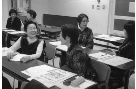
笑顔でコミュニケーション

昨年11月28日(水)、「チームワークが良い組織とは」をテーマに、合計29名の方が受講されました。