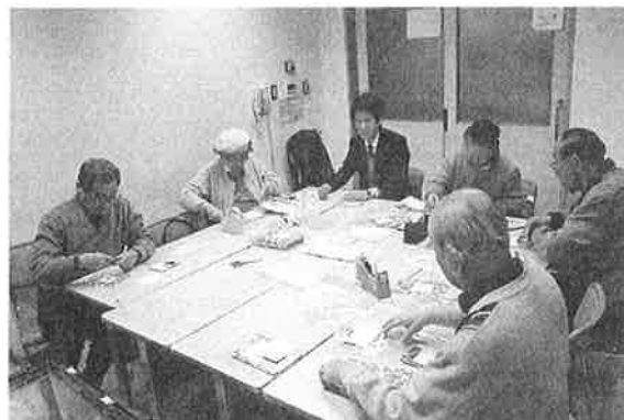
被災地写真洗浄ボランティア