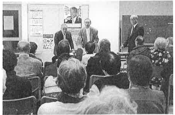
全体会（就業先の発表）