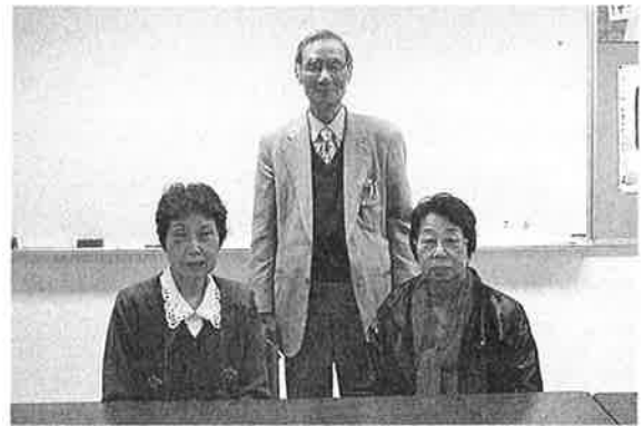
総務・企画委員会

適正就業に関しては、コンプライアンスが求められる今日、理事会一体となって取り組んでいます。